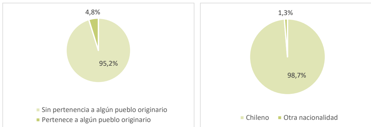
Gráficos 2 y 3. Distribución de asistentes según nacionalidad y pertenencia a algún pueblo originario, 2018