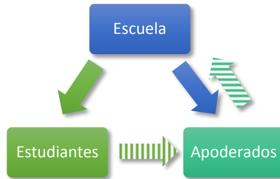
FIGURA 2 FLUJO DE INFORMACIÓN ESCUELA - HOGAR